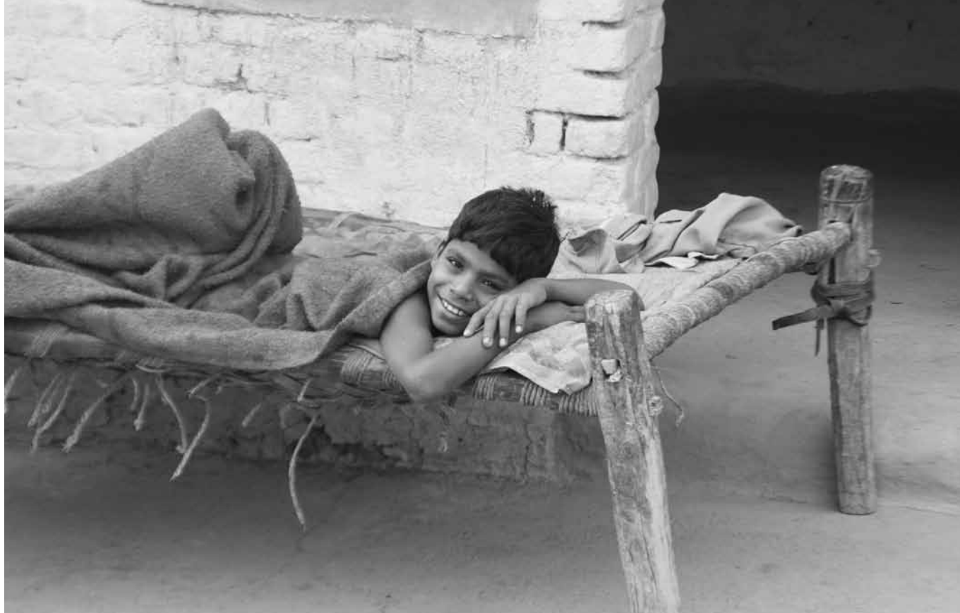
Junge in einem indischen Dorf nach dem Mittagsschlaf