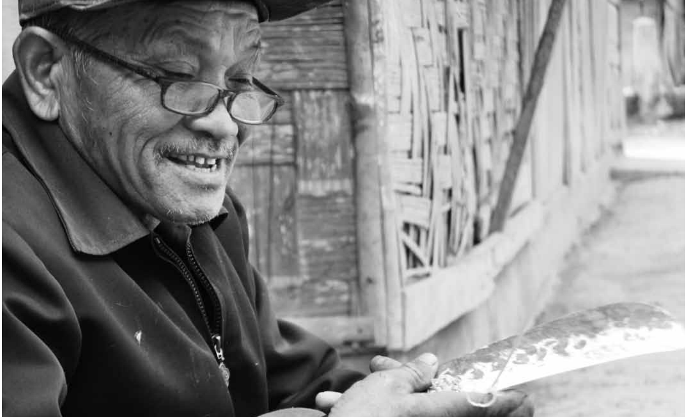
Mann beim Schnitzen eines Bambuskorbes in Laos