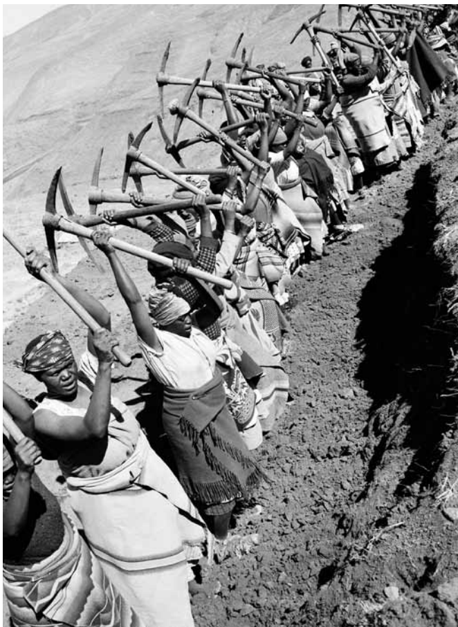
Frauen beim Bau eine Straße in Lesotho

Unter NRO ist umstritten, ob Schuldenerlasse angerechnet werden sollten. Für ihre Anrechnung spricht, dass sie eine zentrale NRO-Forderung waren und daher auch Anerkennung finden sollten. 9 Das europäische Schuldennetzwerk Eurodad argumentiert jedoch dagegen, denn es handelt sich bei den erlassenen Beträgen meist um so genannte Phantomschulden (aufgelaufene Strafzinsen für ausgefallene Kredite), illegitime Schulden (ohne Zustimmung der Bevölkerung an autokratische Regime vergebene Kredite) oder erlassene Exportkredite. Hier werden also Mittel, die ursprünglich keinen Entwicklungszweck hatten, nachträglich zu Entwicklungshilfe umgedeutet. Dies setzt eine äußerst großzügige Auslegung der DAC-Kriterien voraus.