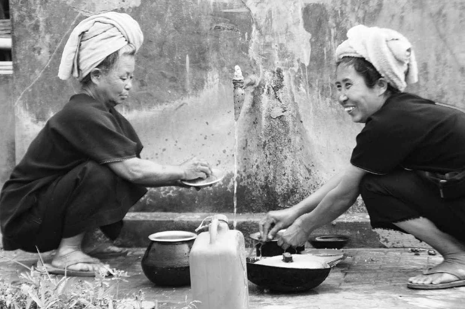
Pao-Frauen beim Spülen am Dorfbrunnen in Myanmar

ner Ebene haben sich sowohl die Bundesregierungen – der derzeitigen und vergangenen Legislaturperioden – als auch parteiübergreifend die Mehrheit der Abgeordneten des aktuellen Deutschen Bundestags im Rahmen des sogenannten »Entwicklungspolitischen Konsens« 2011 zum 0,7-Prozent-Ziel bekannt. Andere Geberländer haben es sogar in nationales Recht umgesetzt und damit tatsächlich »verrechtlicht«. Obwohl Deutschland nicht zu den Ländern gehört, die das 0,7-Prozent-Ziel erreicht haben, hält die Bundesregierung das politische Bekenntnis dazu aufrecht. Während die Beiträge entwickelter Länder in anderen Bereichen der Entwicklungsfinanzierung und Politikkohärenz ähnlich großen Nutzen (oder auch Schaden) für Entwicklungsländer zur Folge haben können, ist die Entwicklungsfinanzierung der Bereich, in dem Regierungen ihre Verpflichtungen zur Bekämpfung der Armut am ehesten anerkennen. Dies ist unter anderem ein Ergebnis des permanenten Drucks zivilgesellschaftlicher Organisationen. Die international eingegangene Verpflichtung ist dabei ein wichtiger Referenzrahmen für die NRO.