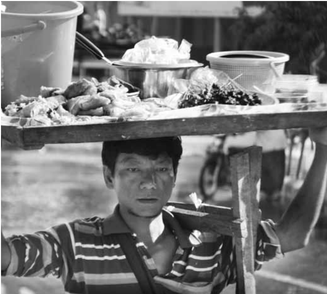
Straßenverkäufer in Mandalay, Myanmar