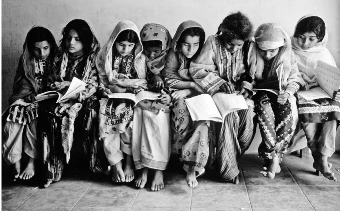
Schulmädchen in einer Leseklasse in Karatchi, Pakistan

Per Übereinkunft der Vereinten Nationen sollten Schuldenerlasse nicht von der Leistung von ODA ablenken. 10 Einige DAC-Mitglieder rechnen sie daher auch freiwillig nicht auf die ODA an.