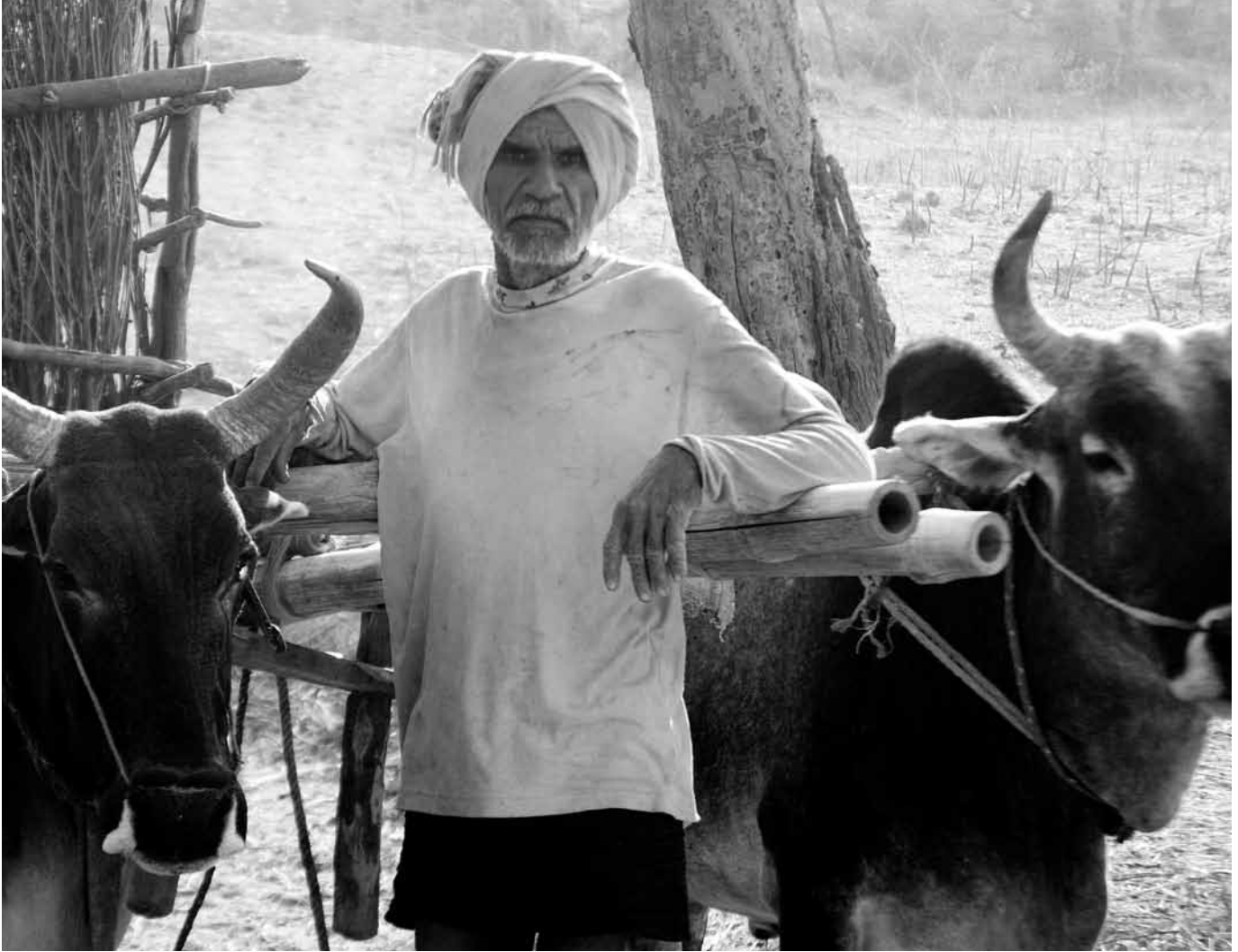
Feldarbeiter in Madhya Pradesh, Indien

lich zur ODA geleistet werden muss. Konkret bedeutet dies, dass die Klimafinanzierung außerhalb der ODA angerechnet werden muss oder dass die ODA-Zielmarke auf einen Betrag weit höher als 0,7 Prozent anzuheben wäre. NRO haben darauf hingewiesen, dass Industrieländer für die Klimafinanzierung im Süden einen zusätzlichen Betrag von mindestens 0,3 Prozent des BNE mobilisieren und transferieren müssten. 20