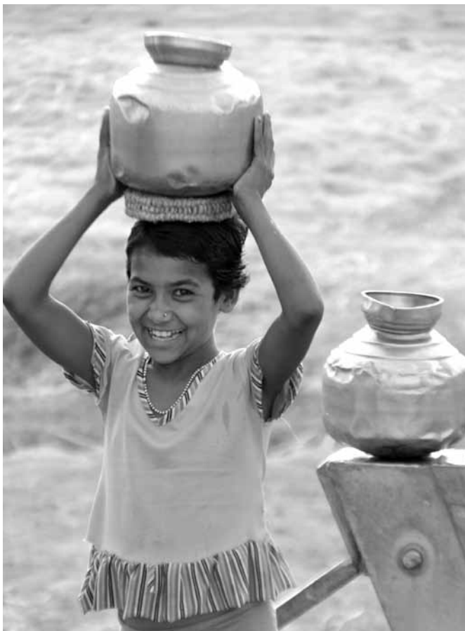
Mädchen in einem indischen Dorf beim Wasserholen

Vor dem Hintergrund der vorliegenden Kritik an der derzeitigen ODA-Berechnung wurden in den vergangenen Jahren Vorschläge für alternative Bemessungsgrundlagen entwickelt: