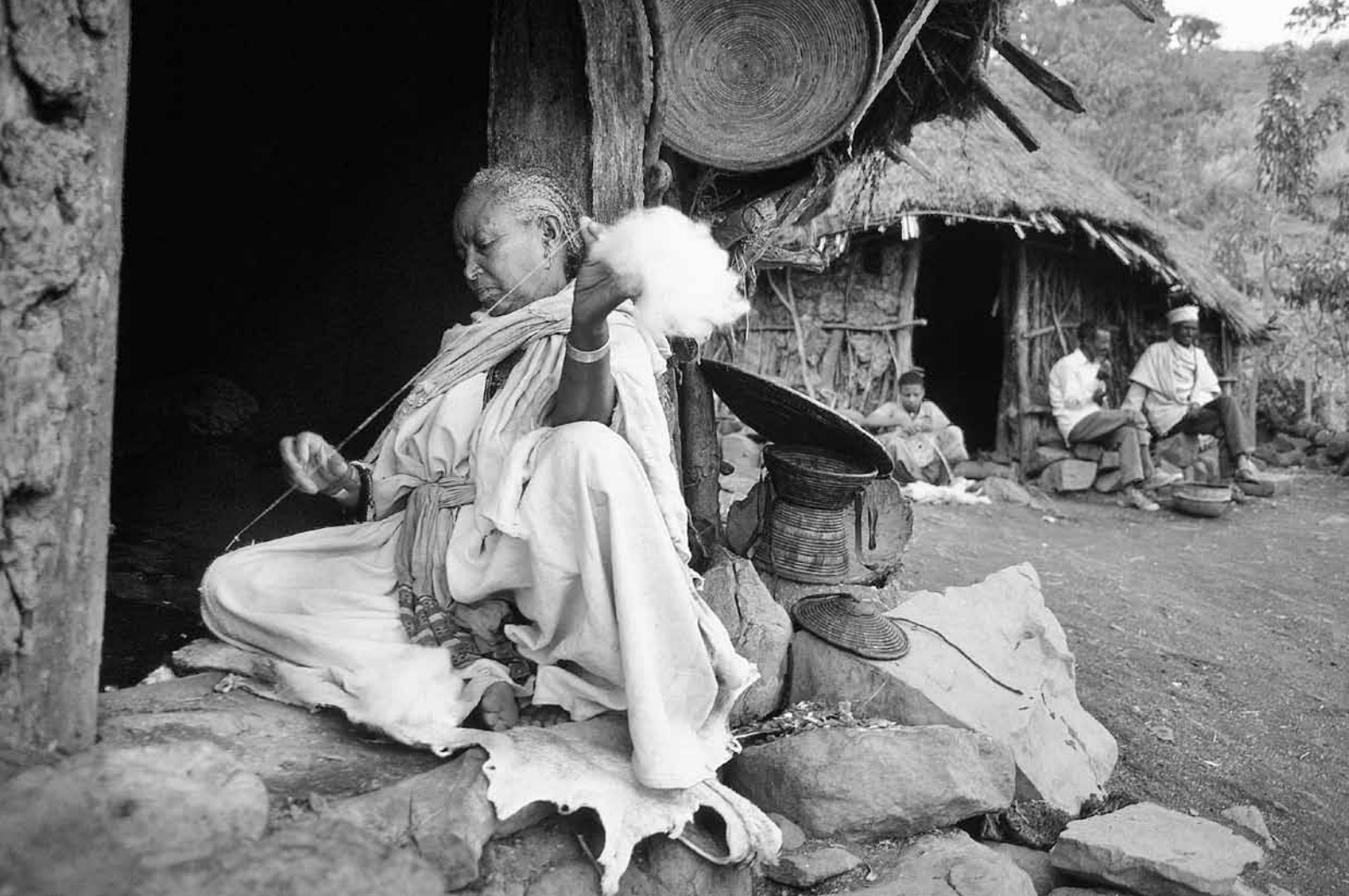
Frau beim Baumwollspinnen in Äthiopien

tische Bildung und Forschung in Geberländern), nicht zwischen Gebern und Empfängerländerregierungen verhandelt werden (zum Beispiel Nahrungsmittelhilfe, institutionelle Förderungen für internationale NRO, Aufkauf von Aktien) oder Schuldentilgungen auf Entwicklungskredite darstellen. Nur etwas mehr als die Hälfte der ODA gilt als CPA (54 Prozent in 2008). Es ist offensichtlich, dass CPA zwar keine exakte Messung des realen Nord-Süd-Finanztransfers darstellt, aber eine bessere als ODA. Sie misst auch besser, welcher Anteil der ODA federführend von den Empfängerländern verwaltet wird. 18